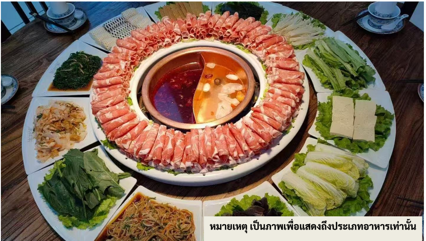
หมายเหตุ เป็นภาพเพื่อแสดงถึงประเภทอาหารเท่านั้น

วิธีการปรุงเนื้อแกะอันเป็นเอกลักษณ์ ท่านอาจจะแปลกใจที่เห็นการนำน้ำแข็งก้อนใสๆ มาใส่ในหม้อก่อน จากนั้นจึงใส่เนื้อแกะตามลงไป น้ำแข็งจะค่อยๆ ละลายกลายเป็นน้ำ และน้ำนั้นจะค่อยๆ ต้มเนื้อแกะจนสุก วิธีการนี้จะทำให้เนื้อแกะที่ได้นั้นมีความแตกต่างจากปกติอย่างเห็นได้ชัดเจน ด้วยความนุ่มละมุนและคงความสดใหม่ของรสชาติได้มากกว่าเดิม **กรณีที่ท่านใดไม่ทานแกะและวัวจะมีเนื้อหมูบริการ**