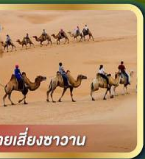
• เป็นทรายสีงาชวาน