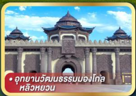
• อุทยานวัฒนธรรมมองโกเลียหลวง