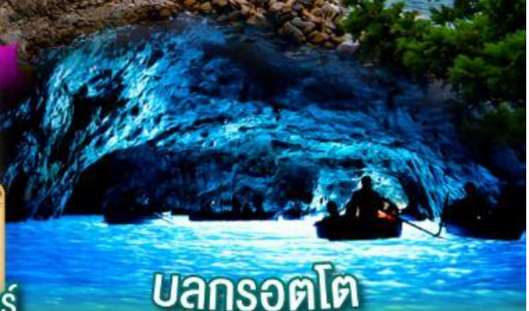
บลูกรอตโต

พิเศษ!! ล่องเรือไฮโดรฟอยล์สู่เกาะคาปรี่ ชมบลูกรอตโต และดินแดน 5 หมู่บ้านชิงเกวแตรี่เร่