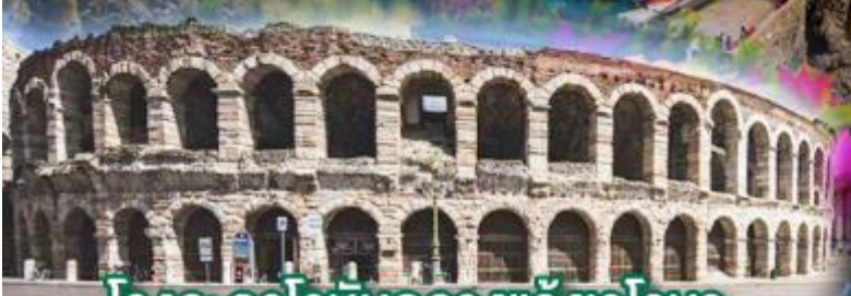
โรงละครโรมันกลางจั๊งวโรนา