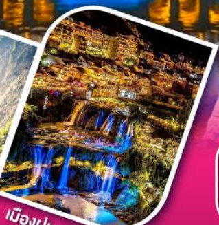
เมืองฝูหรงเจิ้น