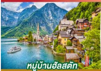
หมู่บ้านอัลสตัด