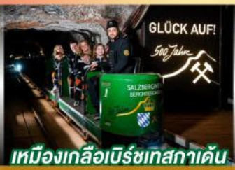
เหมืองเกลือเบิร์ชเทสกาเดิน