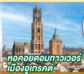
หอคอยดอกทิวาวอร์ เมืองอูเทรคต์