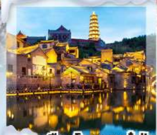
เมืองโบราณกุ๋เป่ย์