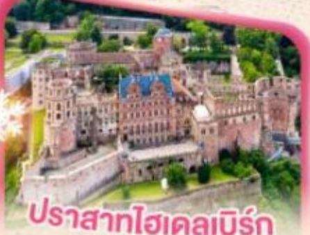
ปราสาทไฮเคลเบิร์ก