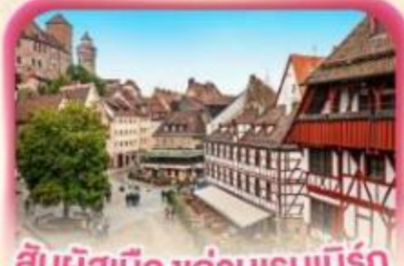
สัมผัสเมืองเก่าบูเรเบิร์ก