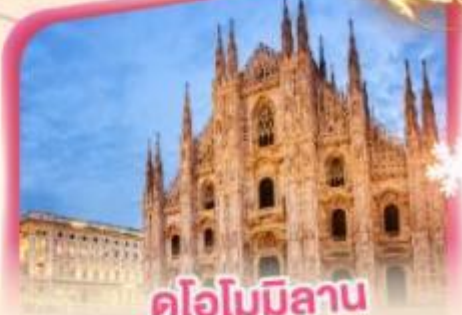
ดูโอโมมิลาน