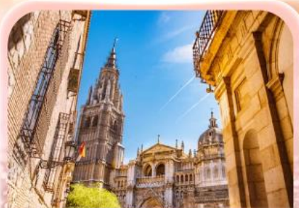
มหาวิหารแห่งโทเลโด