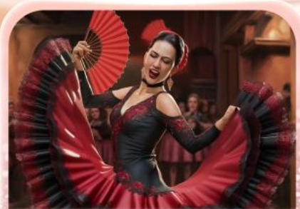
ระบำฟลามิงโก