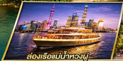
ล่องเรือแม่น้ำหวงผู่