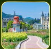
สวน Alice's Garden