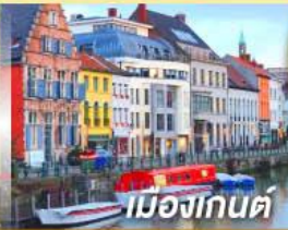
เมืองกันต์