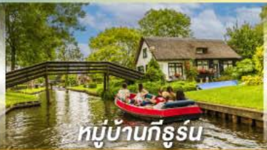
หมู่บ้านทีรูร์น