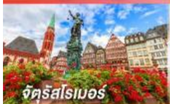
จัตุรัสโรเมอร์