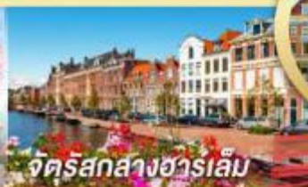
จัตุรัสสากสางฮาร์เล็ม