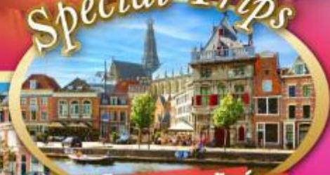
เก็บครบเบเนลักซ์ แวะเที่ยวฮาร์เล็ม