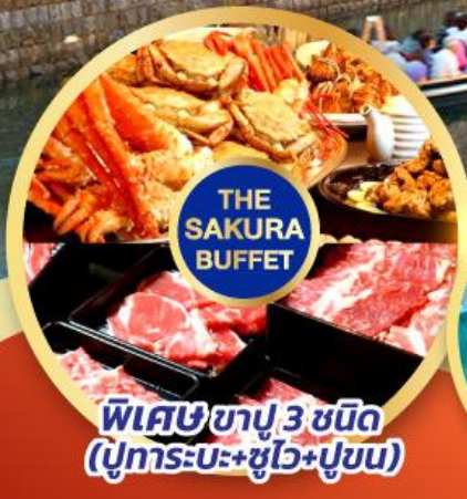
พิเศษ ซาซึ 3 ชนิด (ปูทารุเนะ+ซูโง+ปูขม)