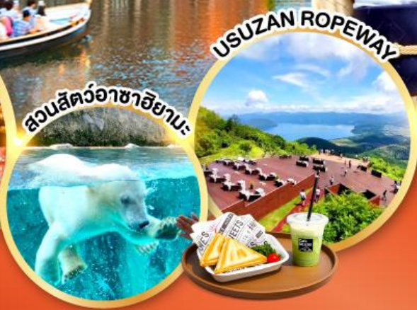
สวนสัตว์อาซาฮิยามะ