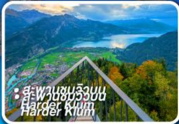
• สะพานขมลิ้งบน Harder Klettersteig