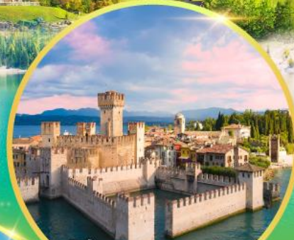
ซีร์มิโอเน