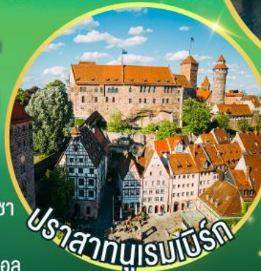
ปราสาทบูเรนเบิร์ก