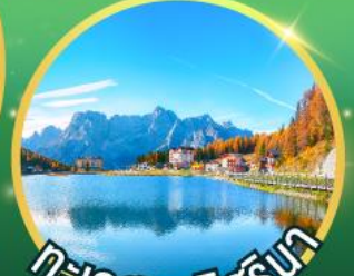
ทะเลสาบมิสุรีนา