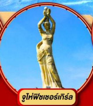
จูไห่พีชเชอร์เกิร์ล