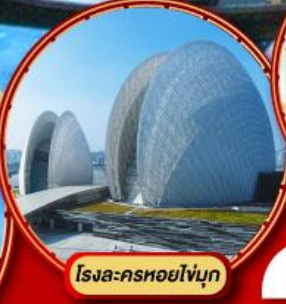
โรงละครหยกไข่มุก