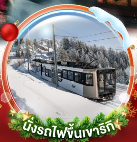
นั่งรถไฟขึ้นเขารัก