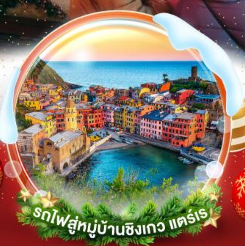
รถไฟสู่หมู่บ้านซิงเกว แครร์

สุดแสนจะโรแมนติกกับตลาดคริสต์มาส 3 เมือง สตราสบูร์ก บาเซล เวโรน่า