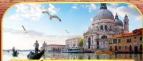
นั่งเรือสุทเกาะเวนิส