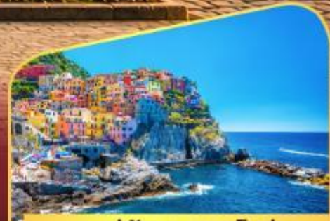
หมู่บ้านมานาโรล่า