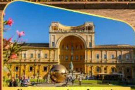
เข้าชมพิพิธภัณฑ์วาติกัน