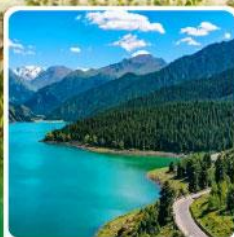
อุทยานเทียนชาน เทียนฉือ