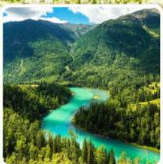
ทะเลสาบคานาสือ