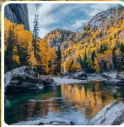
เคอเคอทัวไห่