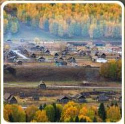
หมู่บ้านเหมอู่

สวรรค์ใบไม้เปลี่ยนสี เยือนคานาสีอแดนฝัน มหัศจรรย์หมู่บ้านเหมอู่ เคอเคอทัวไห่อัศจรรย์ภูผาหิน