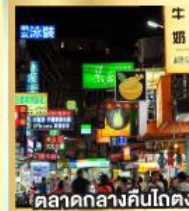
ตลาดกลางคืนโกตง