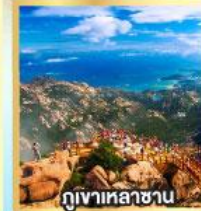
กุเขาหลาซาซาน