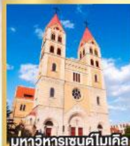
มหาวิหารเซนต์ไมเคิล