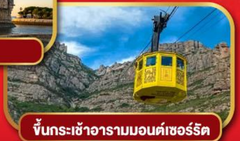
ขึ้นกระเช้าอารามมอนต์เซอร์ริต