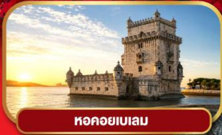
หอคอยเบเลม