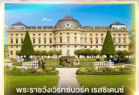
พระราชวังแวร์ทซ์บวร์ค เรสซิเดนซ์