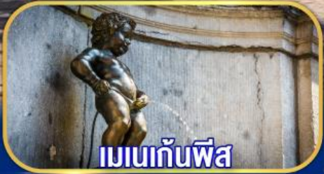
เมเนกั้นพีส