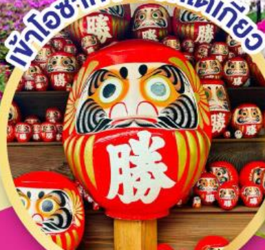
วัดคัตสึโฮจิ (วัดดาร์มะ)