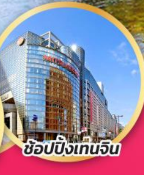
ช้อปปิ้งเทนจิน

สะพานที่สวยงามที่สุดในญี่ปุ่น สะพานคินโตเคียว