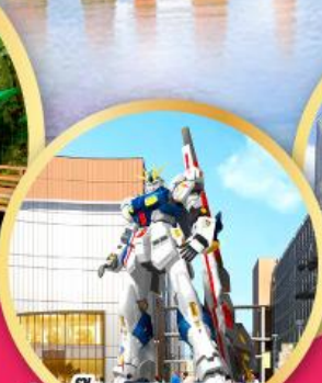
กันดั้มปาร์คฟุกุโอกะ