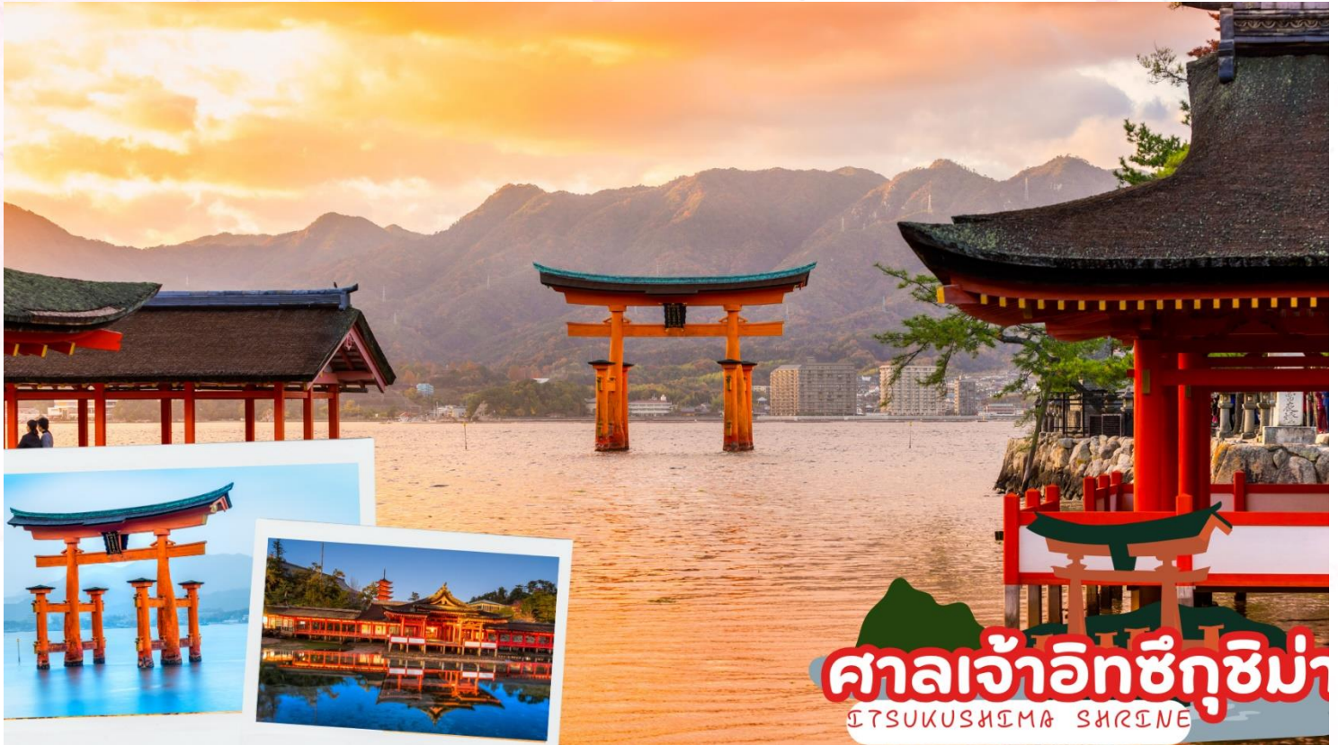
ศาลเจ้าอิซึคุชิม่า ITSUKUSHIMA SHRINE

นั่งเรือเฟอร์รี่เพื่อข้ามสู่ เกาะมียาจิม่า สถานที่ที่ได้รับยกย่องว่ามีทิวทัศน์สวยที่สุด 1 ใน 3 ของญี่ปุ่น และประตูดั้งกลางน้ำ “โอะโตรีอิ” อันเลื่องชื่อ จากนั้นนำท่านสักการะ ศาลเจ้าอิซึคุชิมะ (Itsukushima Shrine) ศาลเจ้าศักดิ์สิทธิ์ที่สร้างคร่อมทั้งบนบกและในทะเล สันนิษฐานว่าสร้างขึ้นในปี พ.ศ. 1136 เพื่อบูชาเทวีแห่งท้องทะเลซึ่งเป็นธิดาสามองค์ของอะมะเทระสุเทวี ในขณะที่น้ำขึ้นเต็มทีนั้น ศาลเจ้าจะเหมือนเรือขนาดยักษ์ที่ลอยน้ำอยู่ ศาลเจ้าแห่งนี้ได้รับการขึ้นทะเบียนเป็นมรดกโลกในปี พ.ศ. 2539 และรัฐบาลญี่ปุ่นได้ยกฐานะให้เป็นสมบัติประจำชาติ