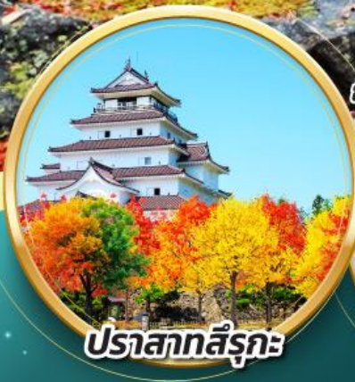
ปราสาทสิรุกะ