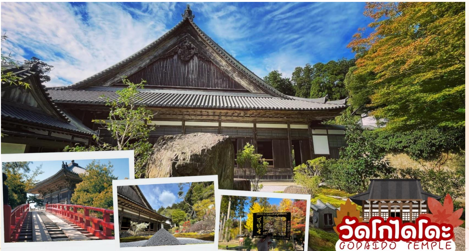
วัดโกไดโดะ GODAIDO TEMPLE

กลางวัน รับประทานอาหารกลางวัน ณ ร้านอาหาร (มื้อที่ 6)