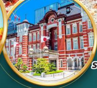
รถไฟ JR TOHOKU SHINKANSEN