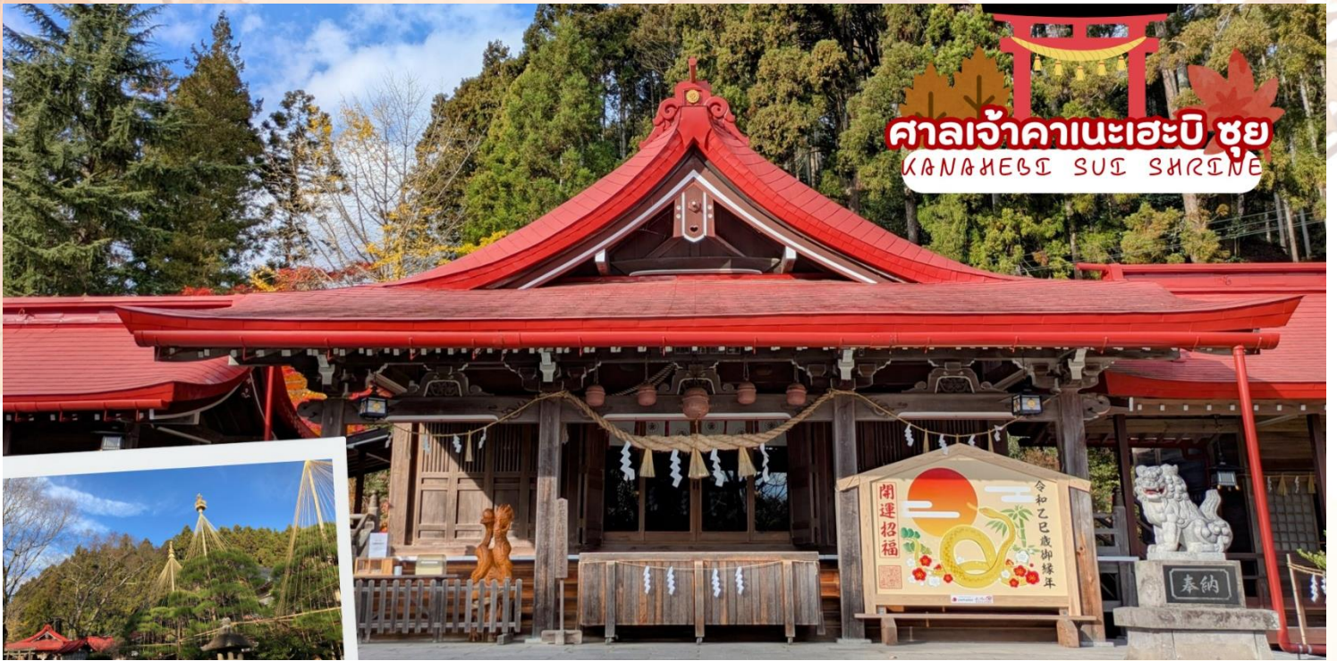
ศาลเจ้าคานะเฮะจิ ชูย KANAMEJI SUJU SHRINE

กลางวัน รับประทานอาหารกลางวัน ณ ร้านอาหาร (มื้อที่ 6)