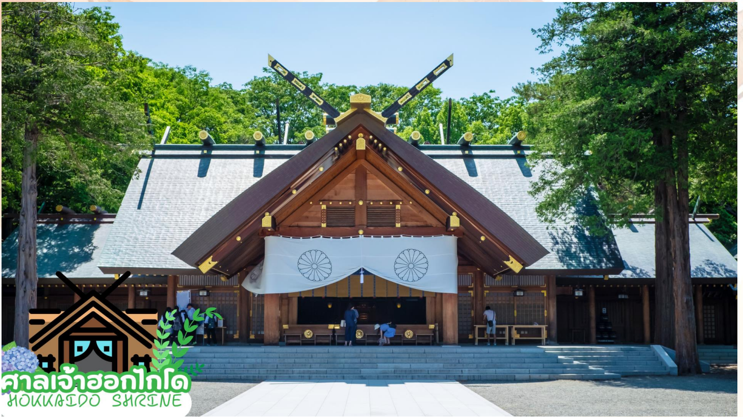
ศาลเจ้าฮอกไกโด HOKKAIDO SHRINE

กลางวัน รับประทานอาหารกลางวัน ณ ร้านอาหาร (มือที่ 9)