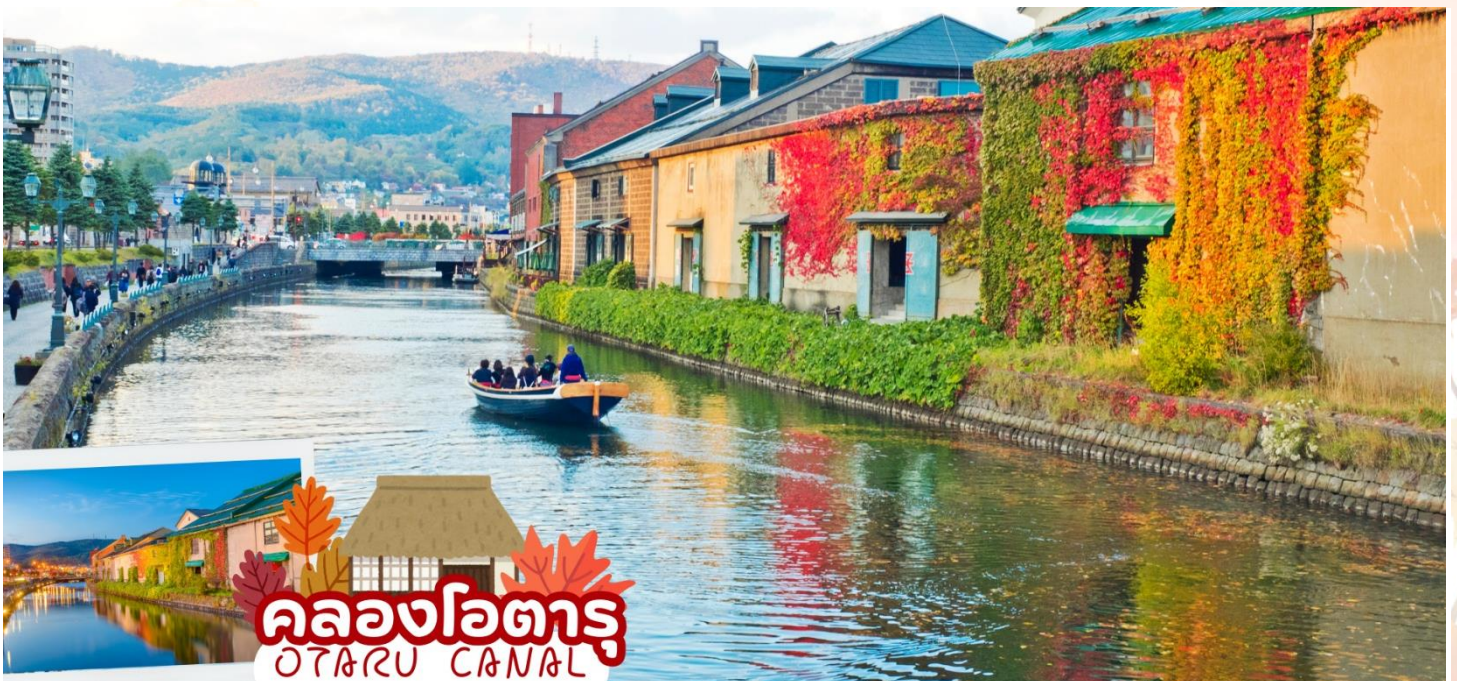
คลองโอตารุ OTARU CANAL

นำท่านเดินทางสู่ เมืองโอตารุ (Otaru) เมืองโรแมนติกของเกาะฮอกไกโด ที่ควบคู่ไปกับความเก่าแก่และความสำคัญทางประวัติศาสตร์ แวะชม คลองโอตารุ (Otaru Canal) ที่มีความยาว 1,140 เมตร และเชื่อมต่อกับอ่าวโอตารุ ซึ่งในสมัยก่อนประมาณ ค.ศ.1920 ที่ยุคอุตสาหกรรมการขนส่งทางเรือเฟื่องฟู คลองแห่งนี้ได้ถูกใช้เส้นทางในการขนส่งสินค้าจากคลังสินค้าในตัวเมืองโอตารุ ออกไปยังท่าเรือบริเวณปากอ่าวให้ท่านเดินเล่น พร้อมถ่ายรูปอัญมณี กับอาคารเก่าแก่ริมคลองและวิวทิวทัศน์ที่สวยงาม