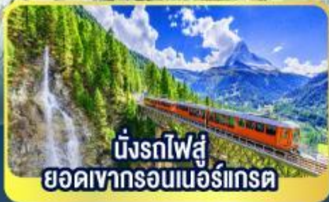
นั่งรถไฟสู่ ยอดเขารอนเนอร์เกรต