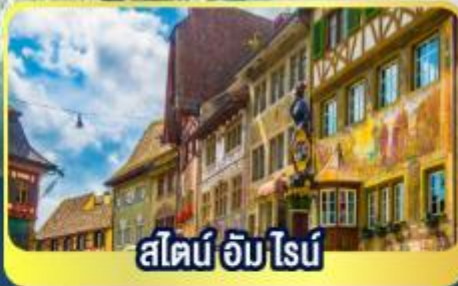
สไตน์ อัม ไนน์