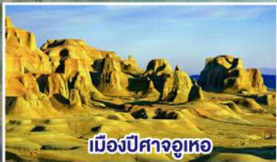
เมืองปีศาจจวูเทอ