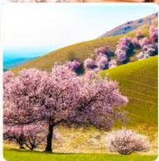
ทุ่งดอกอัลมอนด์