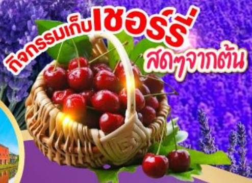
กิจกรรมเก็บเชอร์รี่ สดๆจากต้น