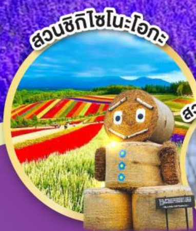
สวนซิกิโซโนะโอกะ