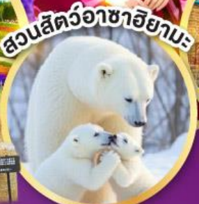
สวนสัตว์อาซาฮิยามะ