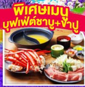
พิเศษเมนู บุฟเฟ่ต์ชาบู+ข้าว