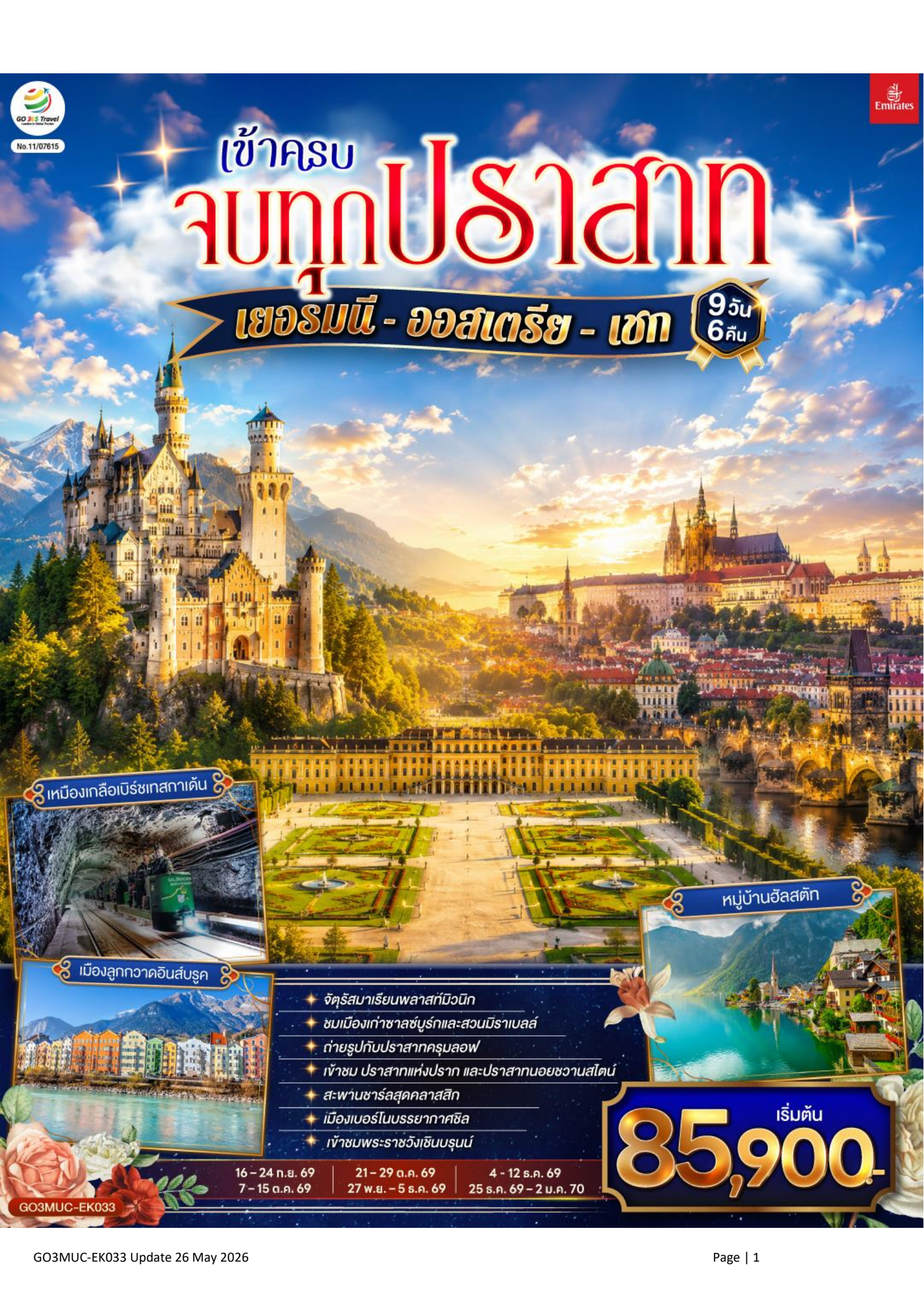
เหมืองเกลือบิรชเทสกาเดิน