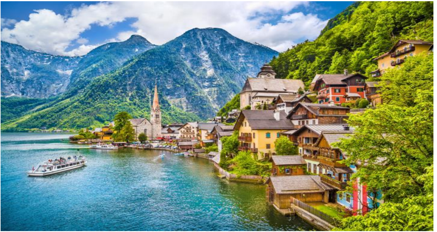
กลางวัน รับประทานอาหารกลางวัน ณ ภัตตาคารพื้นเมือง (ปลาจากทะเลสาบฮัลสตัดท์)