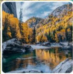
เคอเคอทัวไห่