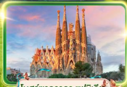
โบสถ์ซากราดา แฟมิลีย