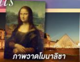
ภาพวาดโมนาลิซา