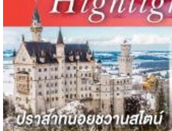
ปราสาทน้อยชวานสไตน์