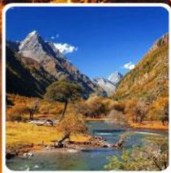
ชวงเจียวโกว