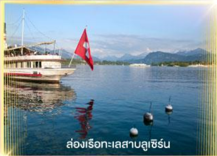
ล่องเรือทะเลสาบลูซิิร์น