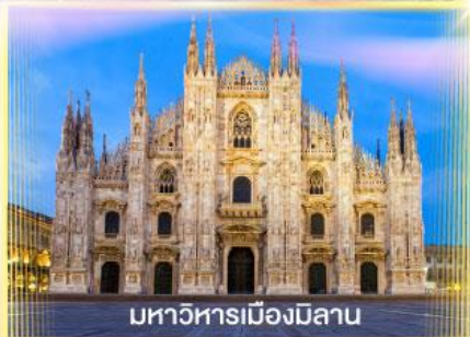
มหาวิหารเมืองมิลาน