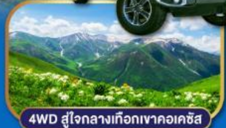
4WD สู่ใจกลางเทือกเขาคอเคซัส