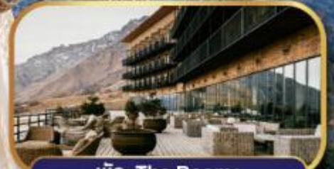
พัก The Rooms