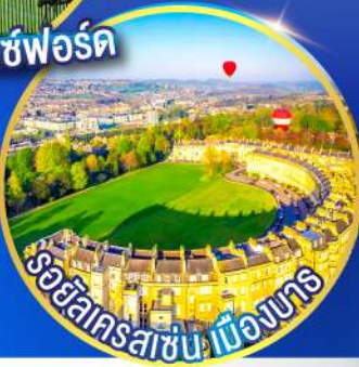
รอยัลครอสซิง เมืองบาร

เข้าชมสโตนเฮนจ์ 1 ใน 7 สิ่งมหัศจรรย์ของโลก อิสระวันเดียวทริปในลอนดอน