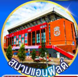
สนามแอสตันวิลล่า