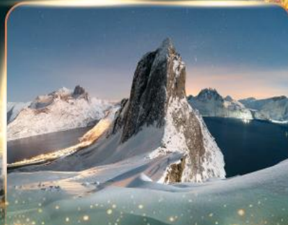
เกาะเซนญา