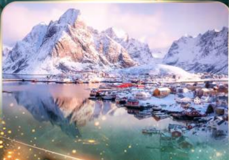
หมู่บ้านเรนเน