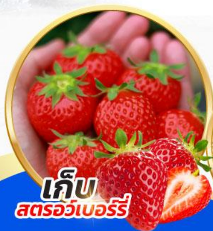
เก็บ สตอว์เบอร์รี่