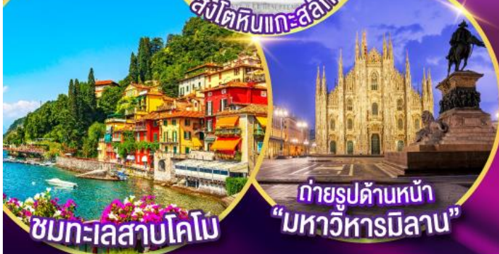
ถ่ายรูปด้านหน้า "มหาวิหารมิลาน"