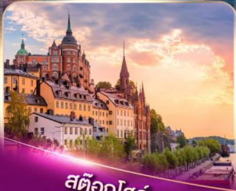
สต็อกโฮล์ม เวนิสแห่งยุโรปเหนือ