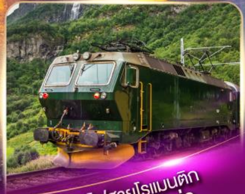
รถไฟสายโรแมนติก ฟลิมส์บาน่า