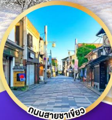
ถนนสายชาฟิยว