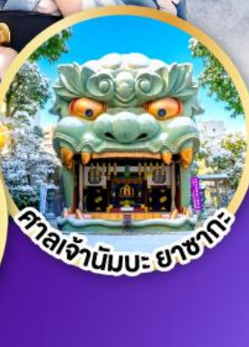
ศาลเจ้าฮิมะ ยาชากะ