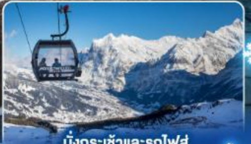
นั่งกระเช้าและรถไฟสู่ ยอดเขาจุงเฟรา