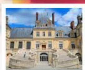
พระราชวังฟงแตนโบล