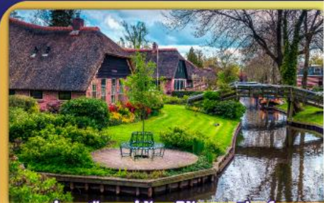
ล่องเรือหมู่บ้านไรทนนท์รูร์น