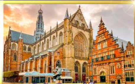
จัตุรัสเมืองฮาร์เล็ม

พรมแดนเมืองแปลกเนเธอร์แลนด์และเบลเยียม เดินเมืองเคลฟท์ เมืองเครื่องปั้นดินเผาระดับโลก