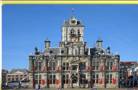
อาคารเมืองเก่าคลองเมืองเคลฟท์