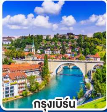
กรุงบิรน์