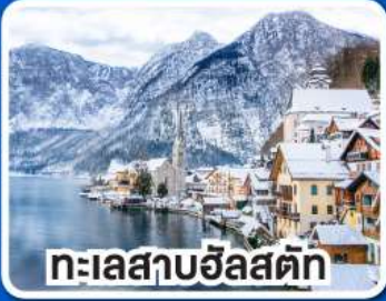
ทะเลสาบฮิลสติก