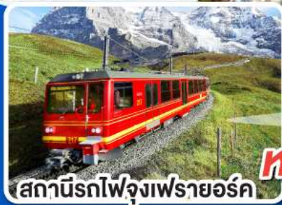
สถานีรถไฟจุงเฟรายอร์ด