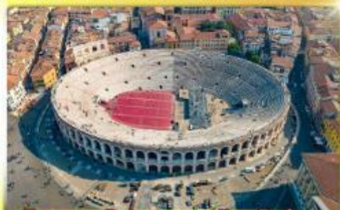
โรงละครโรมันกลางจัหวโรม่า