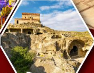
เมืองถ้ำอพลิสตซิเคห์

พัก Rooms Hotel โรงแรมวิวหลักล้านของเทือกเขาคอเคซัส